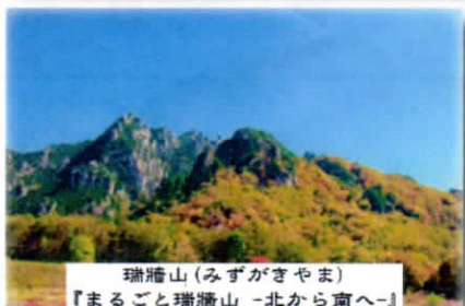
瑞牆山（みずがきやま） 『まるごと瑞牆山 -北から南へ-』