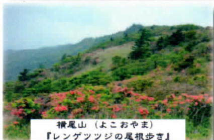
横尾山（よこおやま） 『レンゲツツジの屋根歩き』