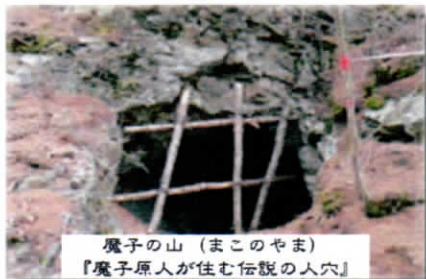
魔子の山（まこのやま） 『魔子原人が住む伝説の人穴』