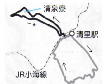
※地図はどちらも概略図です。